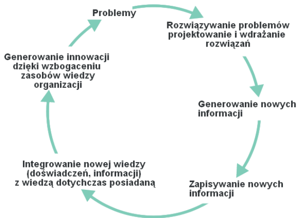
Rys. 1. Schemat jednopętlowego uczenia się